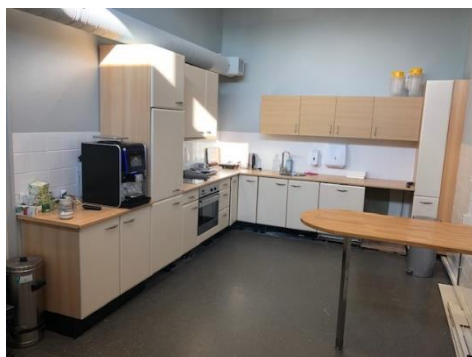
Een grote keuken, met daarnaast een ruime teamkamer, met eindelijk lékkere koffie. Vanwege de voormalige twee locaties hebben we nu wel alles dubbel: kopjes, handdoeken, bestek...