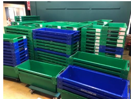
Uitgepakte lege meterbakken staan opgestapeld te wachten tot ze (vandaag) worden opgehaald