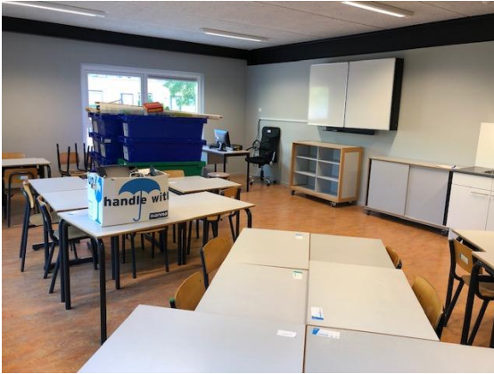
We zijn druk bezig met de inrichting en aankleding van de lokalen